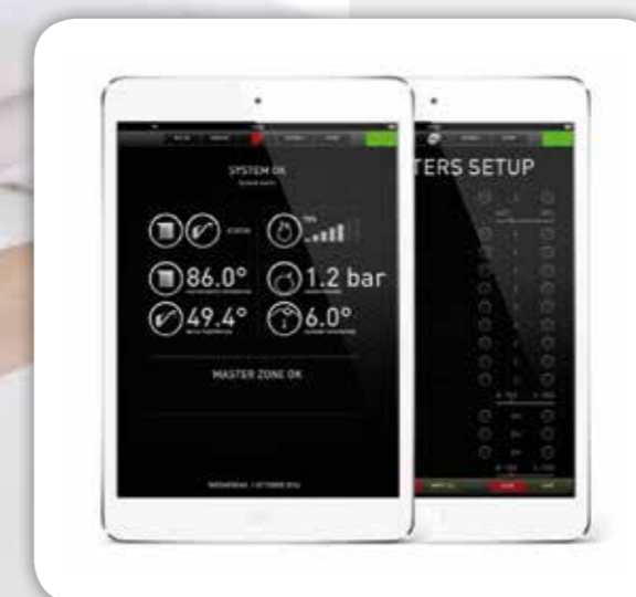
2. APP ПОЛЬЗОВАТЕЛЯ