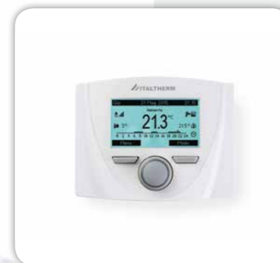
1. ИНТЕЛЛЕКТУАЛЬНЫЙ ДИСТАНЦИОННЫЙ КОНТРОЛЬ